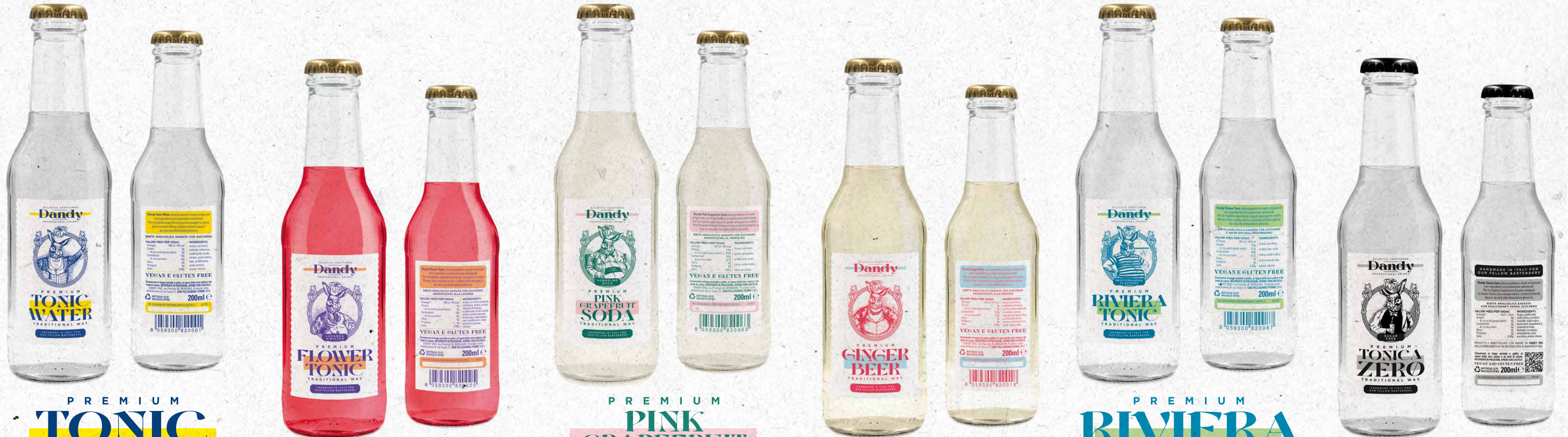
PREMIUM TONIC WATER TRADITIONAL WAY